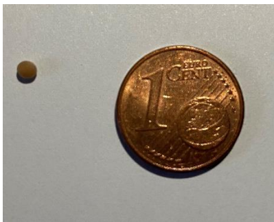
Ein Senfkorn ist kleiner als ein Cent-Stück!

Gottes neue Welt ist wie ein Senfkorn. Ein Senfkorn ist der kleinste Samen, den es gibt. Aber wenn es gesät ist, wächst es zu der größten Kräuterpflanze von allen. Die Pflanze wird so groß, dass Vögel in den Zweigen wohnen können.