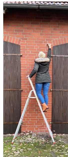
Die Pflanze kann bis zu 3 Meter groß werden!

Eine erwachsene Person muss auf eine Leiter steigen und den Arm ausstrecken, um so groß zu sein!