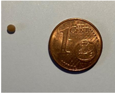
Ein Senfkorn ist kleiner als ein Cent-Stück!