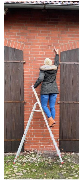
Die Pflanze kann bis zu 3 Meter groß werden! Eine erwachsene Person muss auf eine Leiter steigen und den Arm ausstrecken, um so groß zu sein!

3. 🗨️ Überlegt zusammen, warum die Geschichte ein Gleichnis ist.